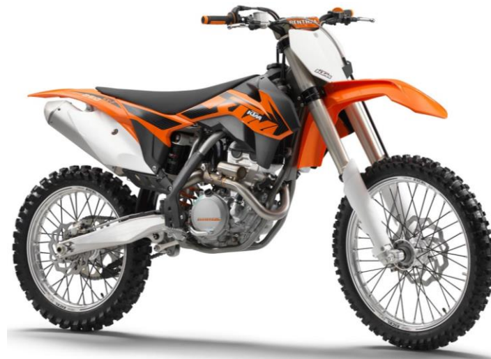
DTC EC ENGINE GUARD KTM SX-F/XC-F 250 2013 Ref: 2CP085111B